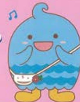
須磨区マスコットキャラクター 「すまぼう」

子どもたちが友だちや 地域の方たちと一緒に、 こども食堂や学習支援等で 楽しい時間を過ごす場所です。