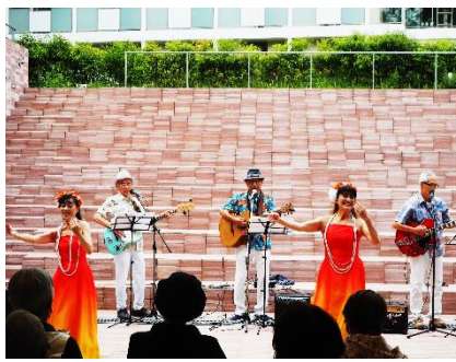
【ヒマナハワイアンズ】