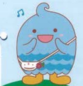
須磨区マスコットキャラクター

すべての子どもたちが放課後や週末に安心して過ごせる居場所です。こども食堂や学習支援などを通して地域の大人の方やお友だちとふれあい、楽しい時間を過ごす場所です。